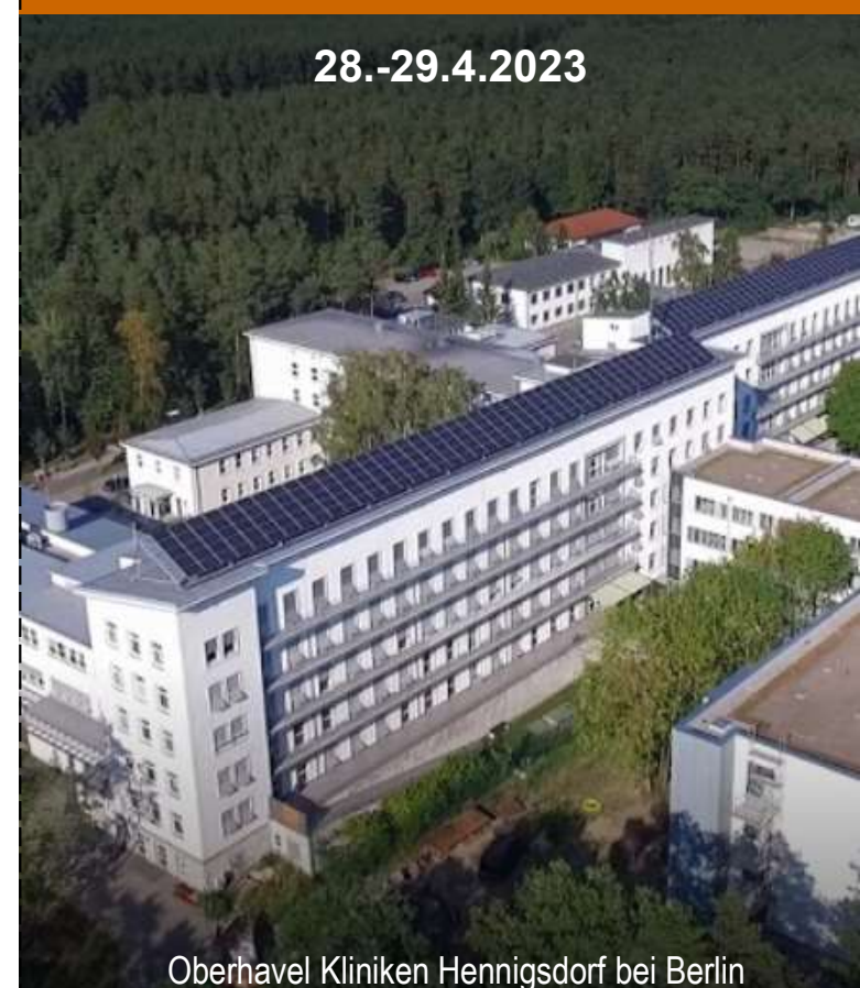
Oberhavel Kliniken Hennigsdorf bei Berlin