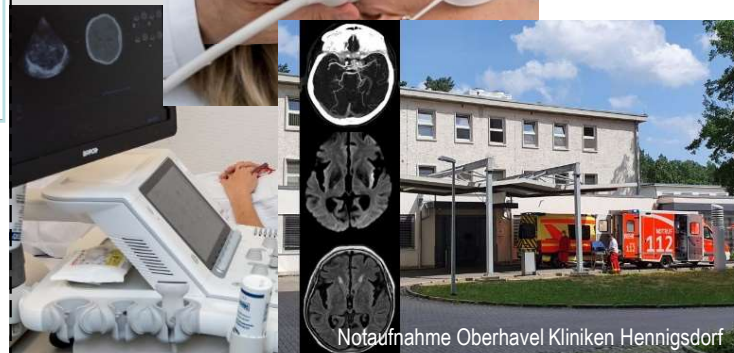
Notaufnahme Oberhavel Kliniken Hennigsdorf