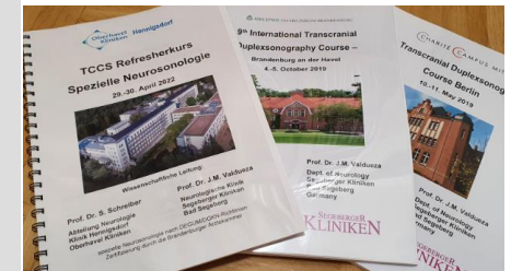
Kurs-Handout mit allen Beiträgen