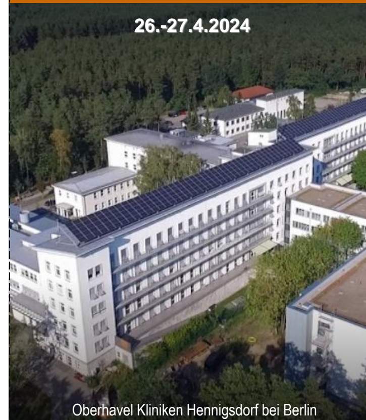
Oberhavel Kliniken Hennigsdorf bei Berlin