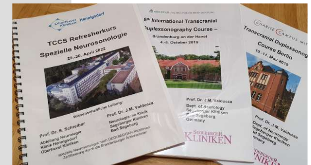
Kurs-Handout mit allen Beiträgen