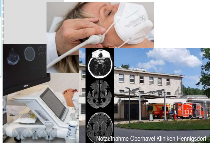
Notaufnahme Oberhavel Kliniken Hennigsdorf