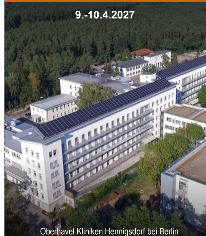
Oberhavel Kliniken Hennigsdorf bei Berlin